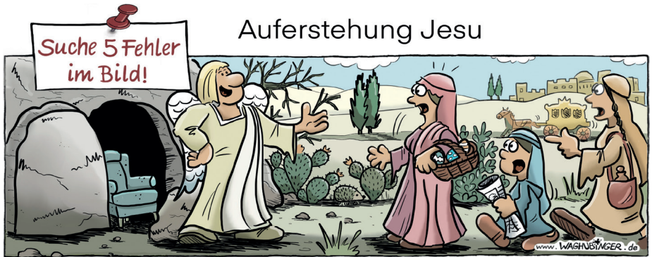
Sessel, Igel, Osterleier, Zeitung, Kutsche